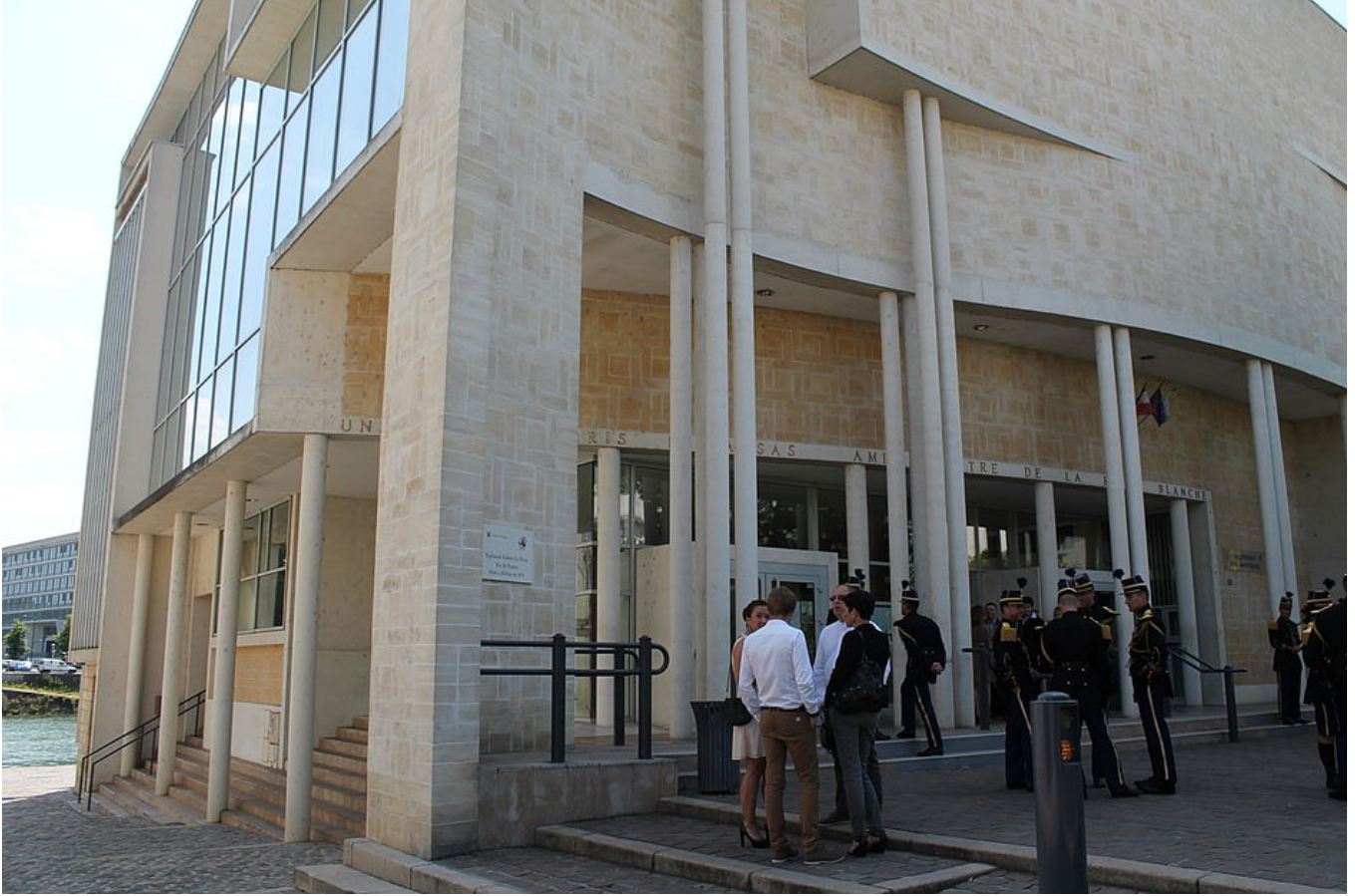
Amphithéâtre de la Reine Blanche