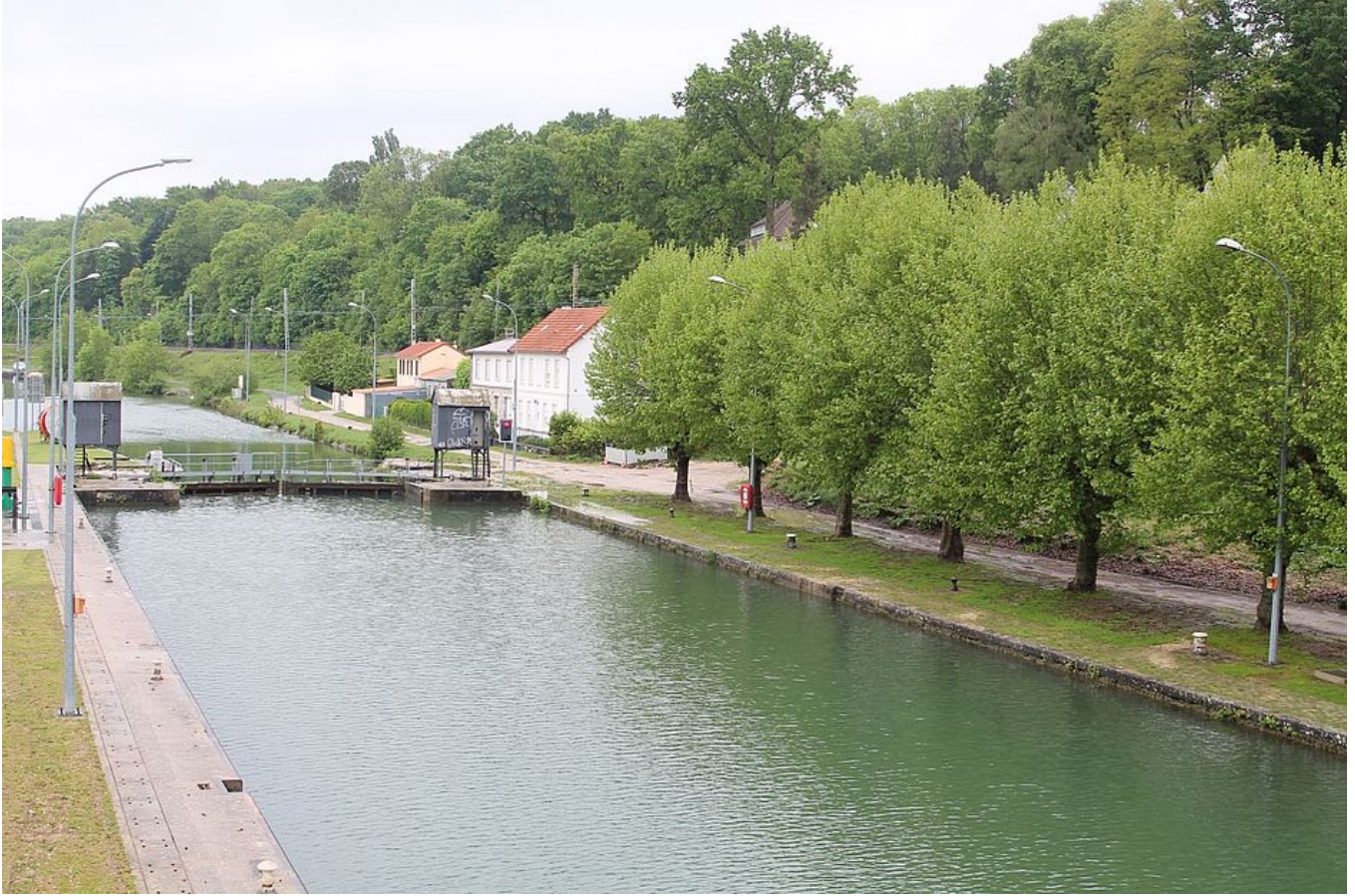
Inauguration de la Passerelle des Vives Eaux