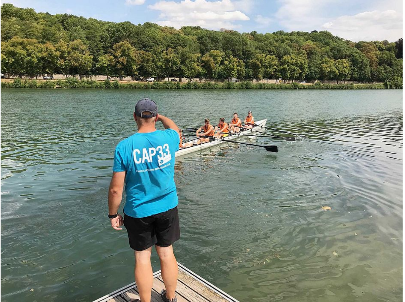
Sport Passion 2019 - Semaine 4 - Melun - Aviron