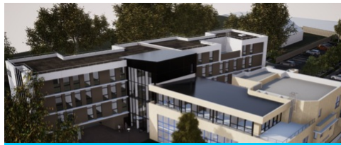
LE CONSEIL COMMUNAUTAIRE