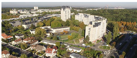
LE NOUVEAU PROGRAMME DE RENOUELEMENT URBAIN