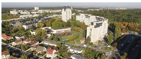
LE NOUVEAU PROGRAMME DE RENOUVELLEMENT URBAIN