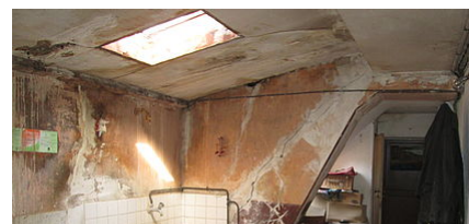
LE PERMIS DE LOUER