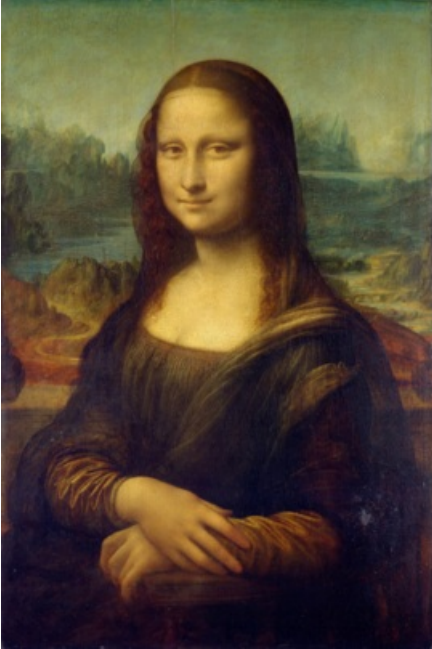
Portrait de Lisa Gherardini, épouse de Francesco del Giocondo dite Mona Lisa la Gioconda ou la Joconde Léonard de Vinci (Vinci, 1452 Amboise 1519) vers 1503-1519 Peinture sur Bois H. : 0.77 m L. : 0.53 m © Léonard de Vinci