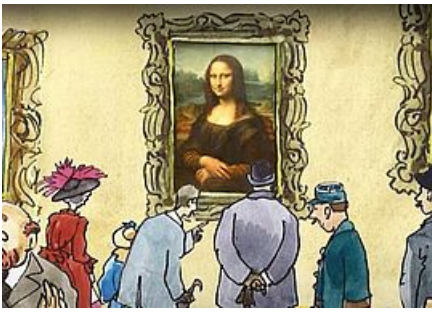
Le Petit Louvre © Le Petit Louvre