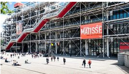
Centre Pompidou à Paris

Rendez-vous sur Youtube pour voir la vidéo sur le vol de la Joconde .