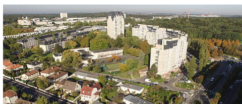
LE NOUVEAU PROGRAMME DE RENOUVELLEMENT URBAIN