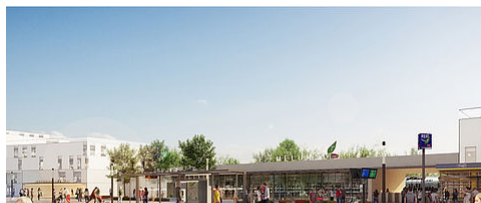
LE PÔLE D'ÉCHANGES MULTIMODAL DE LA GARE DE MELUN