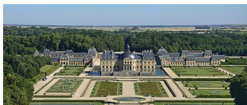
LES 9 ATOUTS DE L'AGGLOMÉRATION