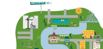
LE BUDGET 2021