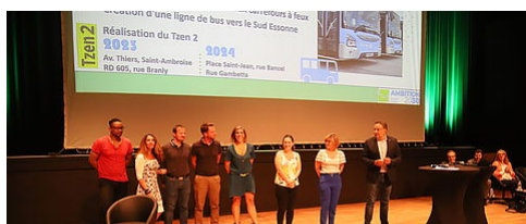
AMBITION 2030 : POINT D'ÉTAPE, 1 AN APRÈS LE LANCEMENT