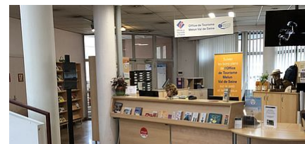
OFFICE DE TOURISME MELUN VAL DE SEINE