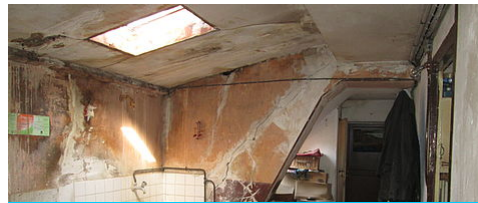
LE PERMIS DE LOUER