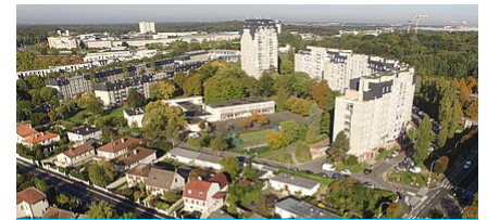
LE NOUVEAU PROGRAMME DE RENOUVELLEMENT URBAIN