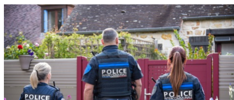
LA POLICE INTERCOMMUNALE