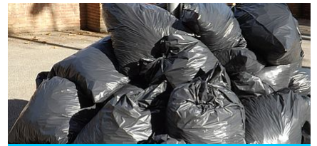
DEMANDE D'EXONÉRATION DE LA TAXE D'ENLÈVEMENT DES ORDURES MÉNAGÈRES (TEOM)