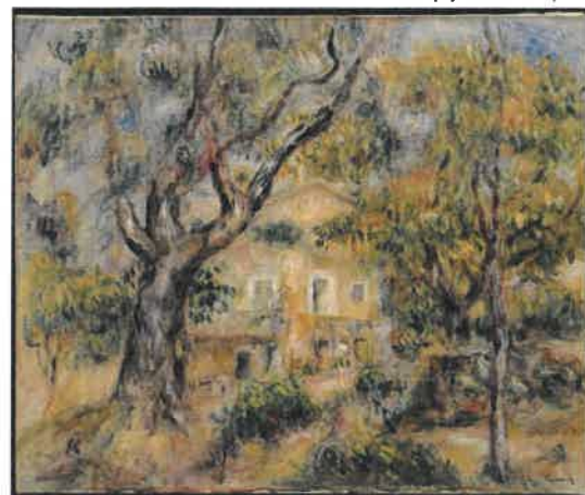
La ferme des Collettes, Cagnes, Auguste Renoir, 1908-14, MET, n° 61.190

Jour et heure : mardi 10h00 à 12h00 Nombre de séances : 6 Lieu : Université Inter-Âges