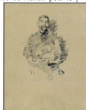
James Whistler, Portrait de Mallarmé, lithographie. Musée départemental Stéphane Mallarmé.

A travers le regard et les écrits de Mallarmé, se sont les grands moments de l'art de la fin du 19 e siècle qui reprennent vie.