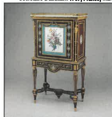
Secrétaire à abatant 1787, France, MET

Jour et heure : Mardi 10h00 à 12h00 Nombre de séances : 10 Lieu : Université Inter-Âges