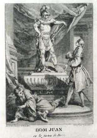
Dom Juan, Laurent Boucher

Force est de constater qu'après autant de versions il s'agit bien de « représentations » de Don Juan : chaque œuvre apporte toujours un regard nouveau sur le libertin. La première de ses caractéristiques est d'être effectivement un grand séducteur sans mesure. Les autres personnages sont en situation par rapport à lui et il sait manifester son autorité démesurée en se confrontant à son environnement : la religion, l'espace et le temps. Don Juan se moque d'autrui et lance un défi constant à la société, à l'Eglise et à Dieu.