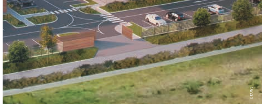
Esquisse de la ZAC Mare-aux-Loups (vue non contractuelle)