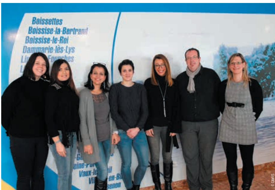
Les six référentes de parcours et le coordonnateur du PRE.

En pratique, le PRE a pour but l'accompagnement individualisé d'enfants en situation de « fragilité ». La plupart du temps, les orientations ont lieu en milieu scolaire, sur la base de multiples critères : état de santé, développement psychique et psychologique, contexte familial, facteurs socio-économiques et environnementaux... Il concerne les enfants, de l'école maternelle jusqu'au collège, voire au-delà dans certains