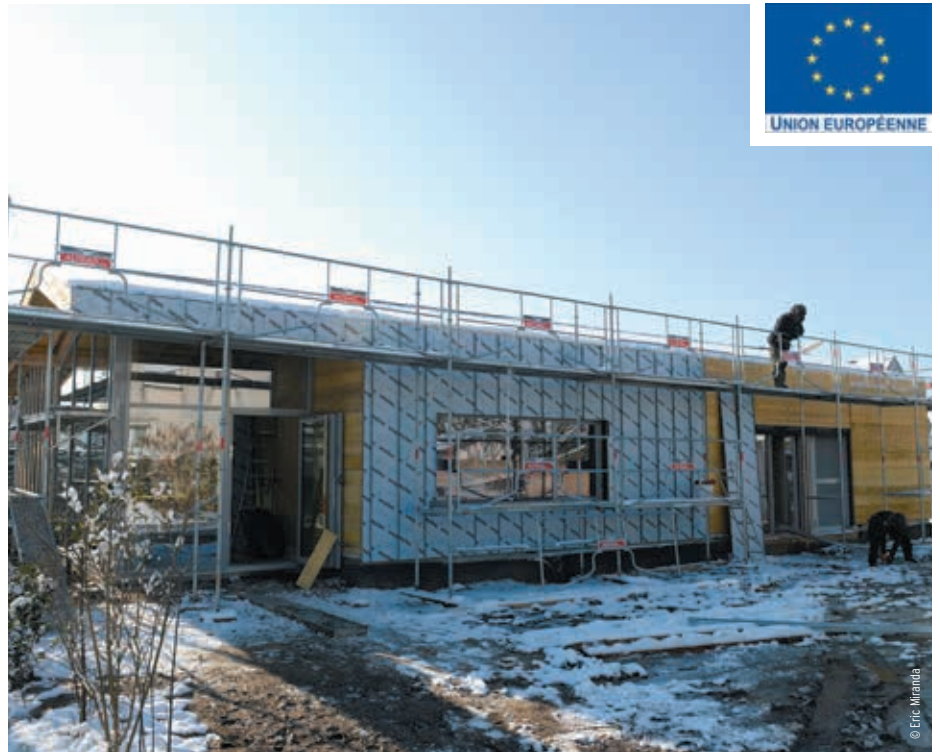
La nouvelle maison médicale de La Rochette accueillera trois médecins généralistes et un cardiologue en 2019

Un troisième projet a reçu l'avis favorable du Comité : la création d'un nouvel équipement