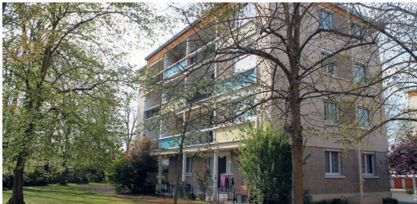
En 2017, la résidence La Chênaie, à La Rochette, a bénéficié de financement Mon Plan Rénov' pour ses travaux.

Le service Habitat de la Communauté d'Agglomération et l'Espace Info Énergie, basé au Mée-sur-Seine, ont pour cela mis en place, l'an dernier, des animations dans les communes de Saint-Fargeau-Ponthierry, Vaux-le-Pénil ou encore Le Mée-sur-Seine. Au programme : des cafés-rencontres avec « des coachs rénov » et des entreprises Reconnues Garantes de l'Environnement (RGE) autour des questions liées à la rénovation énergétique et aux subventions attribuées aux propriétaires. Des balades ont également été mises en place, dans différents quartiers, pour visionner les déperditions de chaleur et les défauts d'étanchéité de pavillons, grâce aux images infrarouges d'une caméra thermique. Vous êtes propriétaire, occupant ou bailleur d'un logement du parc privé et vous projetez de rénover votre logement en 2018 ? Renseignez-vous dès maintenant auprès de l'Espace Info Énergie au 01 64 09 12 72. ■