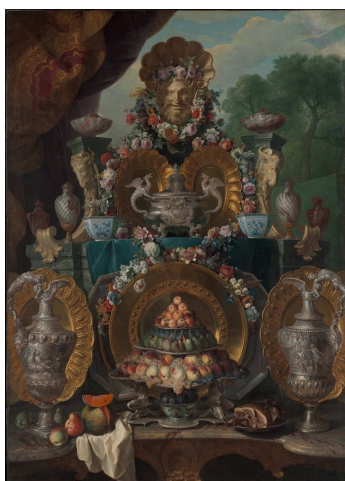
Alexandre-François Desportes (1661-1743)